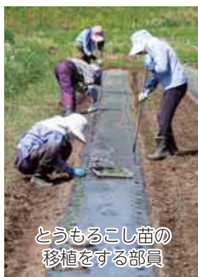
とうもろこし苗の移植をする部員

今年も畑作業が始まりました。王滝支部では畑作業のグループ「かぶらづくり隊」を結成し、地域おこし協力隊員や地域の方（男性もいます）にも作業の協力をしていただきながら、とうもろこしや王滝かぶの生産をしています。高齢化している部員ですが、伝統野菜継承や耕作放棄地対策のため頑張っています。