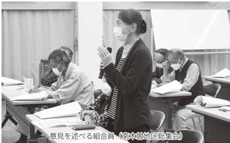
意見を述べる組合員（南木曾地区総集会）

A 取扱高増加は価格高騰の影響です。取扱量は減少しています。肥料の取扱量は前年比93%程、農業に関しては前年比98%でした。