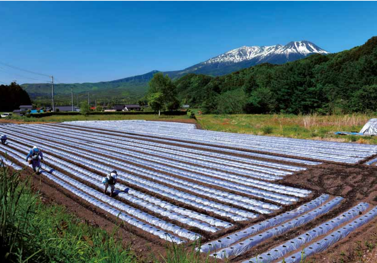
2023年版応募写真入賞作品「収穫の想いを」(木曾町開田高原)