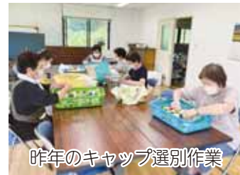
昨年のキャップ選別作業

②、③は参加を追加で受付できますので、JA木曾本所女性部事務局へお問い合わせください。