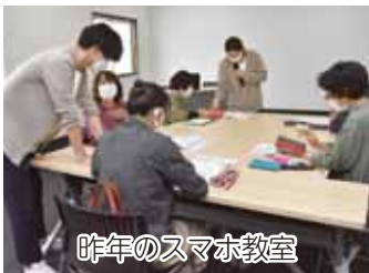
昨年のスマホ教室