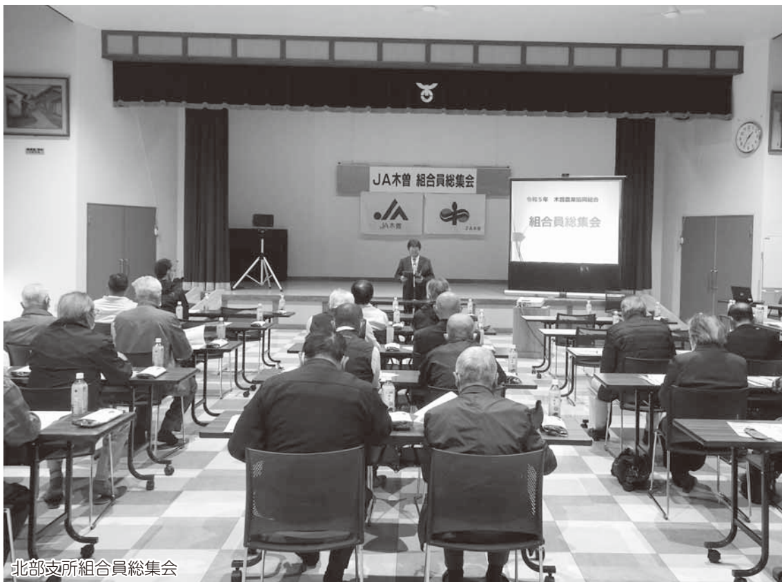
北部支所組合員総集会

4月中旬に開催した各支所組合員総集会において寄せられた主なご意見・ご要望について掲載し、今後のJA運営に反映させてまいります。