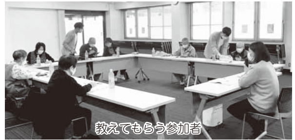
教えてもらう参加者

12月4日 J Aは年金友の会会員を対象にしたスマホ教室を本所会議室で開催しました。ドコモショップ木曾店のスタッフ3人を講師に招き、午前と午後合わせて9人が参加しました。「楽しく便利にインターネットを使えるようになる」を目標に、スマホを使って自分の知りたい情報を調べる方法を学びました。参加者は講師から出された例題を音声検索やキーワード検索などで調べていました。スマートフォンは高齢者層まで普及している一方で操作に不安を抱えたり、便利な機能を使いこなせていなかったりする方も少なくありません。J Aは今後もこのようなお手伝いができる教室を企画して参ります。