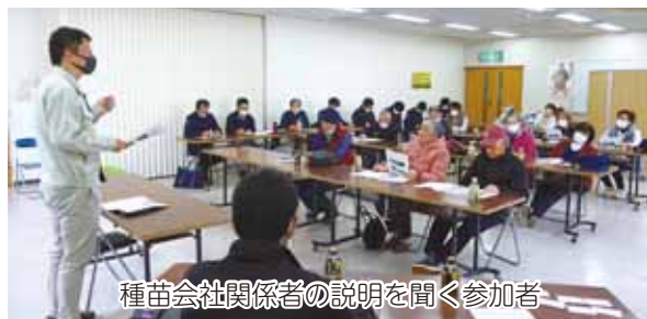
種苗会社関係者の説明を聞く参加者

13人の生産者が出席したインゲン反省検討会では、今年度の生産販売経過の説明と来年度の栽培品種の検討がされました。生産者減と生育不良により数量は落ちたものの、金額は高値傾向が続き前年対比は変わりませんでした。市場からは若干のクレームはありますが、品質も良く金額も木曽の平均は県平均より高くなっており生産者の努力の結果が高く評価されています。