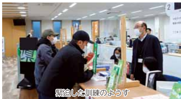
緊迫した訓練のようす

訓練後中部支所の中支所長は「どのような対応をすればよいか難しかった。ほとんどの職員にとって初めての訓練でよい経験になった」と感想を話しました。