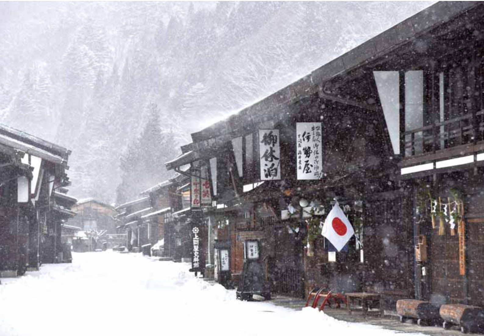
2024年版応募入賞作品「元日」(奈良井宿)