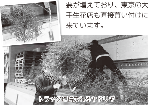
トラックに積まれるヤドリギ

クリスマスの本場欧米では、ヤドリギは幸福をもたらす神聖な木として玄関に飾る風習があるということですが、日本でも装飾用として需要が増えており、東京の大手生花店も直接買い付けにきています。