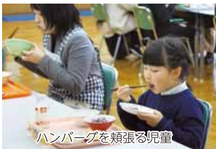
ハンバーグを頬張る児童

11月29日に実施の王滝小学校では、参観日の給食試食会があり保護者や村関係者も参加し、「すんき入り木曽牛ハンバーグ」が提供されました。甘酢で味付けされた王滝かぶのおろしも添えられ、参加者は「初めて食べたがおいしい」と味わっていました。ほかの学校では、すき焼き風煮などの献立が予定されています。