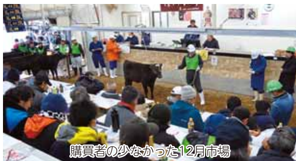
購買者の少なかった12月市場

12月7日 長野県中央家畜市場（木曽町）で定例12月市場が開催され、331頭の取引が成立しました。子牛全体の平均価格は前回10月から13,691円下げて554,048円（税込み）となりました。木曽管内出荷頭数は82頭で平均価格は前回より30,565円下げて522,554円（同）となりました。全国的に子牛相場の低迷は続いており、より安い市場で購入するため購買者が少なく、系統と増体の良い牛に購買者の人気が集まるため個体間格差がより大きい市場となりました。