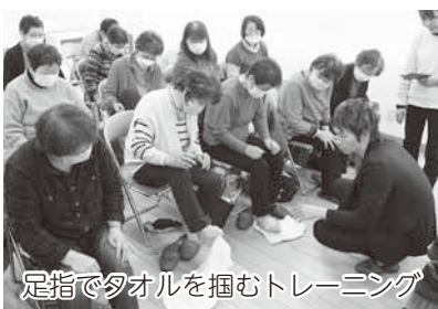
足指でタオルを掴むトレーニング