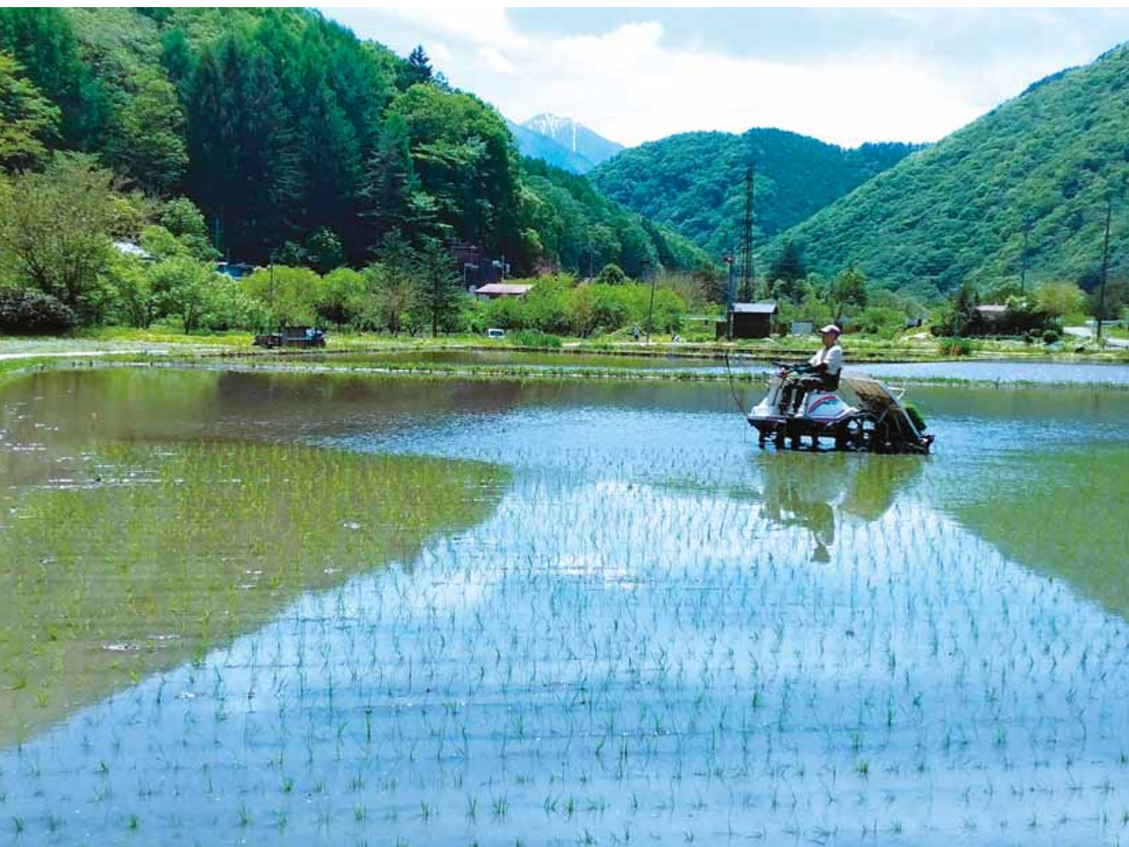
2026年応募写真入賞作品「田植え」(木祖村)