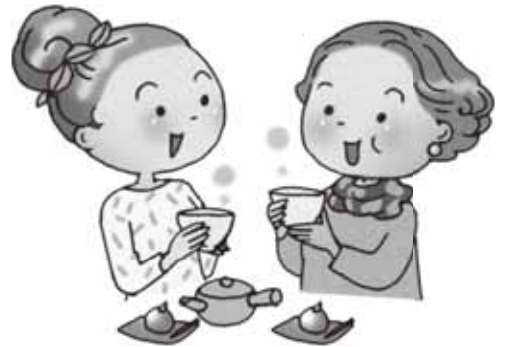
監修：日本茶インストラクター 滝井ひかる イラスト：小林裕美子

忙しい毎日に、 ほっとひと息つける時間はありますか？ 日本茶の香りや味わいに癒やされながら、 心も体も休まる時間を楽しみましょう。